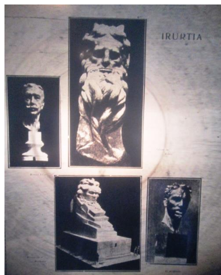
Fotografía N°1: Página con esculturas de Irurtia que acompañan el artículo.

Este tipo de fotografías eran una constante en la publicación, especialmente en el centro donde aparecía la sección “Notas gráficas de Rusia”. Esta ocupaba el lugar central y en los distintos números contó con fotos acerca de las transformaciones en museos y monumentos, la participación de artistas soviéticos en exposiciones de artes europeas, eventos llevados adelante en el propio país y algunas imágenes de obreros trabajando en condiciones justas e igualitarias. En ninguno de los artículos de la revista se halló una crítica de la realidad rusa que perjudicara las condiciones de vida de los trabajadores o campesinos. Se la enfrentó al régimen capitalista y por lo tanto se la concibió como el modo de modificar la situación del proletariado.