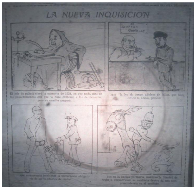
Ilustración 2: Caricatura acerca de la actuación policial 31 .

También, se deben mencionar las secciones no regulares encargadas de difundir sobre sindicatos y organizaciones obreras argentinas, como el caso del Sindicato del Mueble o la Federación Gráfica Bonaerense. Estos se sumaban a las descripciones del funcionamiento de las fabricas soviéticas, demostrando la solidaridad que existía entre la clase proletaria. Al igual que es otro punto de contacto con la actividad del Partido Comunista.