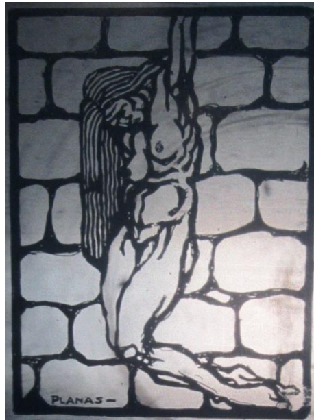
Ilustración 5: Grabado de Planas que acompaña el texto del Prof. Goldschmit “La Prostitución”.