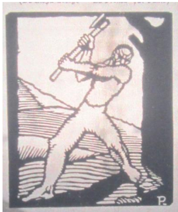
Ilustración 6: Grabado de Planas que ilustra una sección inaugurada en el último número de la revista.

Estos dos ejemplos sirven para analizar la imagen que se buscó representar de las clases populares. Por un lado, en el primer dibujo, se mostraba a una mujer que ejercería la prostitución, según el texto que acompañaba. Se la observaba en una posición de sufrimiento y de esclavitud, al tener sus manos atadas, indicaría que es incapaz de liberarse de su padecimiento. El texto del profesor