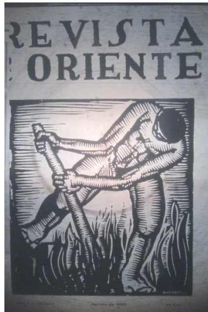
Ilustración 4: Portada Revista de Oriente N°3, agosto 1925.