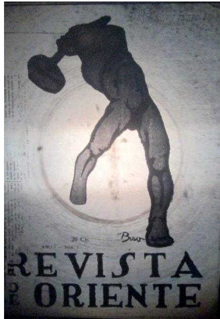
Ilustración 3: Portada Revista de Oriente N°1, junio 1925.